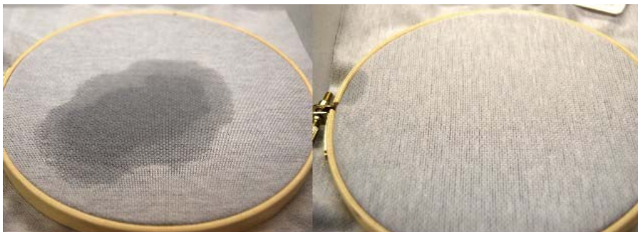
通常のスウェット生地