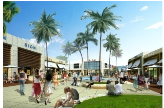
コーストプラザ（イメージ）