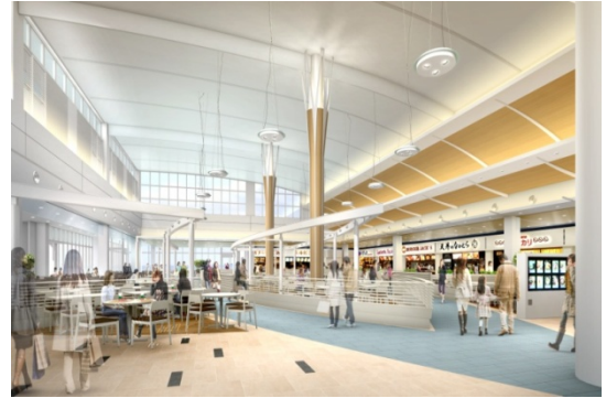
フードコート（イメージ）