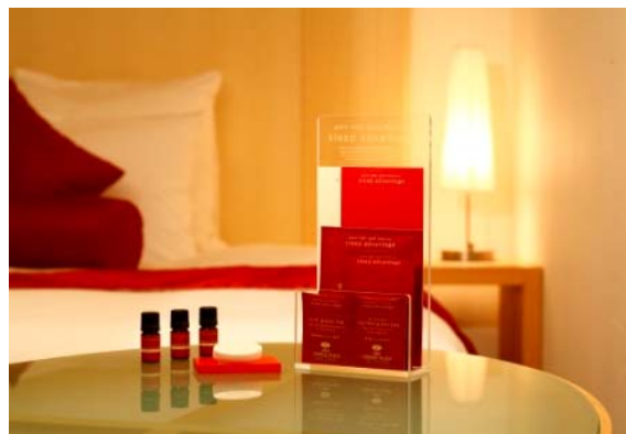
ANA クラウンプラザホテル オリジナル快眠プログラム「Sleep Advantage」