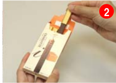
包装紙を引っ張る