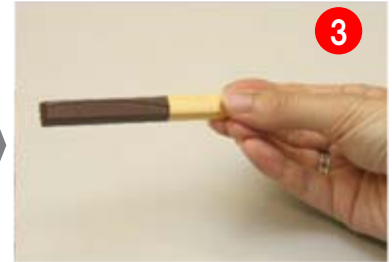
手を汚さずに食べられます