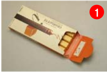
4本入りの個包装タイプ