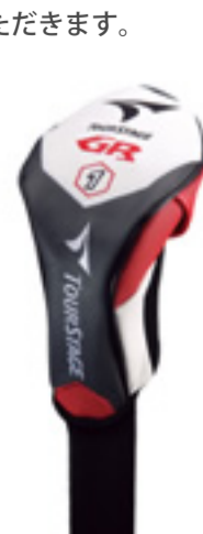
専用ヘッドカバー付(中国製)

※○は通常生産、△は発売開始後しばらくは在庫をご用意しています。在庫終了後は、特注対応とさせていただきます。