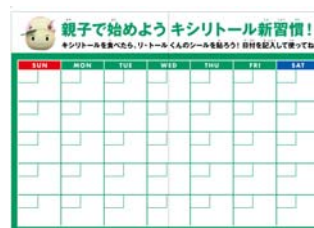
※リーフレット中身