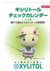
※リーフレット表紙