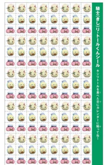
※リーフレット専用シール(全3種)

キシリトール習慣を 実践(ガムを食べる) したらシールを貼り 付ける。コンプリート を目指そう！！