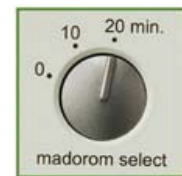
本体上部のスイッチ部

お目ざめまでの時間とまどろみ音は、本体上面の「マドロームセレクトスイッチ」で0分、10分、20分から選択できます。選択した時間に応じて【まどろみ音】【お目ざめ音】が鳴り、心地よい目ざめを演出します。