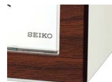
アジアリゾートを感じる木目調柄

前面に木目調の仕立てを施し、リラックスしたリゾートらしさを備えながらスクエアなフォルムと控えめな色遣いで、お部屋の雰囲気を選ばないシンプルな上質さを実現しました。特にモダンインテリアとの相性は抜群です。