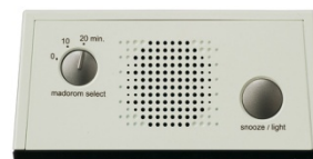
上部のスピーカー

よりクリアな音を再現できるように、上部には目ざまし時計で最良の直径50mmの大きなスピーカーを配置しました。 スヌーズボタンを押すとライトが光り、文字板を照らすので、暗くても時刻がわかります。