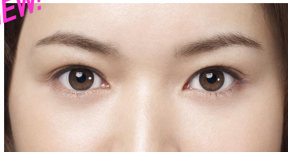
<ナチュラル シャイン™>装用中

★大きく見えるダークグレーのリングに、ハイライトのレイヤーを重ねた、より自然なデザイン。どんなシーンでも浮かないナチュラルな印象に。