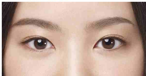
弊社従来品装用中