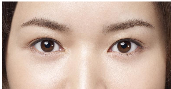
弊社従来品装用中