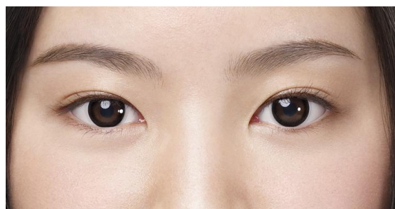
<アクセント スタイル>装用中