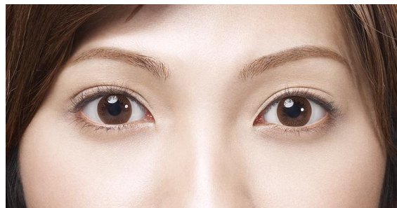
<ヴィヴィッド スタイル>装用中

★大きさを際立たせて、自然になじむ、ダークブラウンのスポークデザインで、明るくキュート。