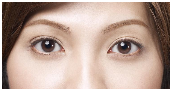
弊社従来品装用中