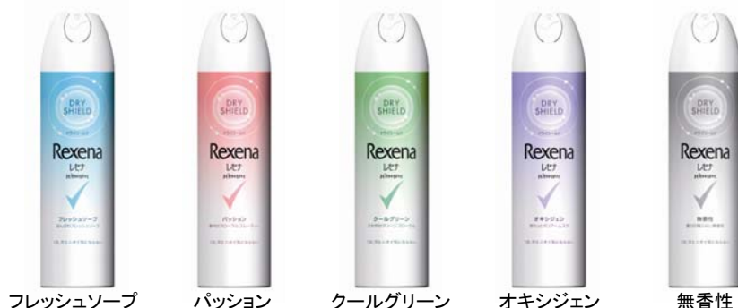
フレッシュソープ

レセナ ドライシールドパウダースプレーの香りは全部で5種類。人気の「フレッシュソープ」「無香性」に加えて、華やかなフローラルフルーティーの「パッション」、さわやかなグリーンフローラルの香りの「クールグリーン」、きりっとクリアーなムスクが特長の「オキシジェン」と、シチュエーションによって選べる豊かなバリエーションが出揃いました。