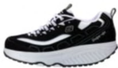
BKW（ブラックホワイト）

商品名：KWC1800 サイズ：23.0～25.5cm 価格：11,550円（税込価格） カラー：BKW（ブラックホワイト）、NTW（ナチュラルホワイト）、WSL（ホワイトシルバー）