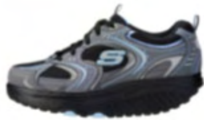
CCBK（チャコールブラック）

商品名：KWC1806 サイズ：22.5～25.0cm 価格：11,550円（税込価格） カラー：CCBK（チャコールブラック）、GYPK（グレーピンク）