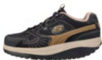
BKBR（ブラックブラウン）

商品名：KMR0876 サイズ：25.0～28.0・29.0・30.0cm 価格：13,650円（税込価格） カラー：BKBR（ブラックブラウン）、NVBK（ネイビーブラック）