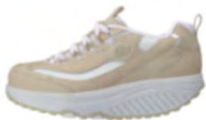
NTW（ナチュラルホワイト）