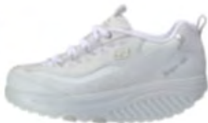
WSL（ホワイトシルバー）

商品名：KWC1801 サイズ：22.5～25.0cm 価格：10,500円（税込価格） カラー：BBK（ブラック）、STBR（ストーンブラウン）、W（ホワイト）