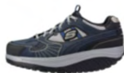
NVBK（ネイビーブラック）