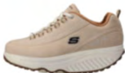
STBR（ストーンブラウン）