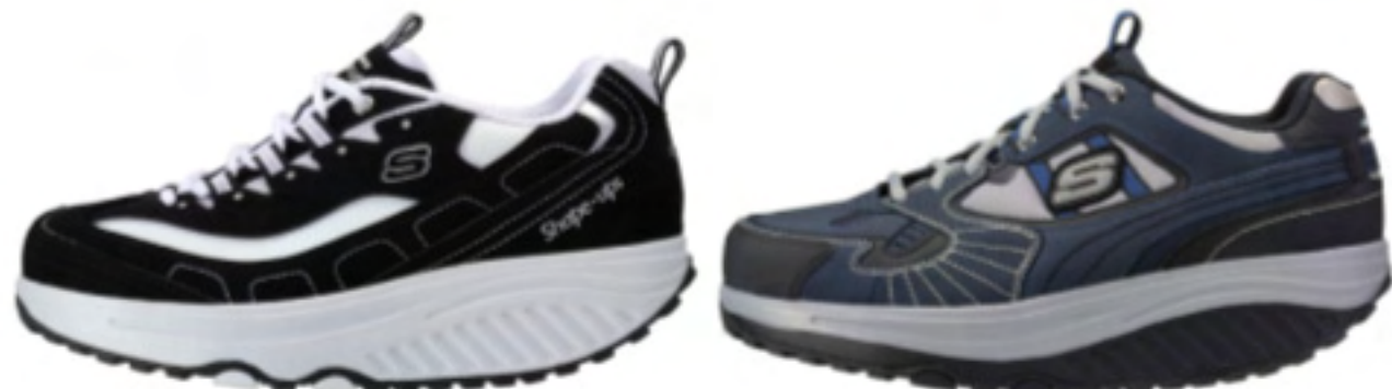
左：【womens】KWC1800 BKW（ブラックホワイト） 右：【mens】KMR0876 NVBK（ネイビーブラック）