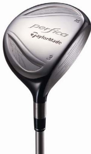
『perfica フェアウェイウッド』