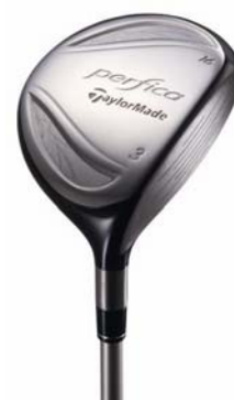
『perfica フェアウェイウッド』

フェアウェイ上でユーティリティを多用する女性ゴルファーのことを考慮し、『perfica レスキュー』では番手が大きくなるにつれてヘッドサイズとボリュームが小ぶりになる「プログレッシブヘッドサイズアンドボリューム」を新たに採用。これにより、アイアンを使用した時の視覚的な違和感を減らし、スムーズなプレーを可能にします。