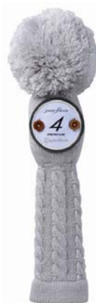
専用ヘッドカバー