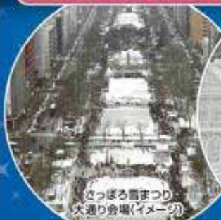
さっぽろ雪まつり 大通り会場(イメージ)