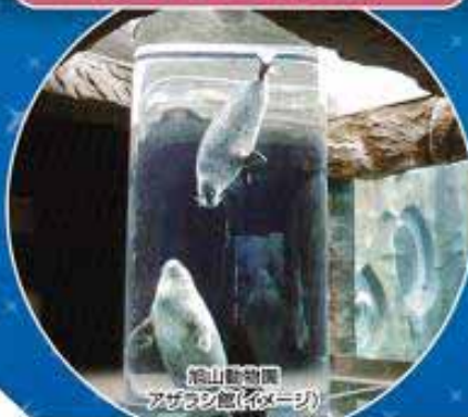
旭山動物園 アザラシ館(イメージ)