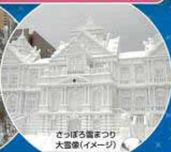
さっぽろ雪まつり 大雪像(イメージ)