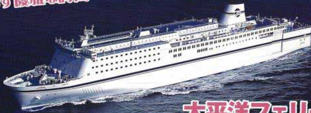
太平洋フェリー「きそ」(イメージ)