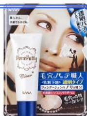
サナ 毛穴パテ職人 化粧下地 クリア 1,000円 (税込 1,050円)