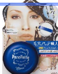
サナ 毛穴パテ職人 フェイスパウダークリア 1,300円 (税込 1,365円)