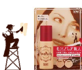
サナ 毛穴パテ職人 化粧下地 1,000円 (税込 1,050円)