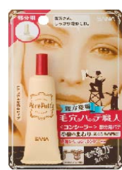
サナ 毛穴パテ職人 部分用パテ 1,000円 (税込 1,050円)