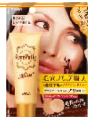
サナ 毛穴パテ職人 化粧下地 モイスト 1,000円 (税込 1,050円)