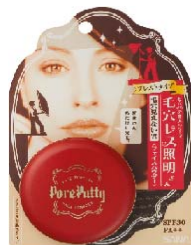
サナ 毛穴パテ職人 フェイスパウダー 1,200円 (税込 1,260円)