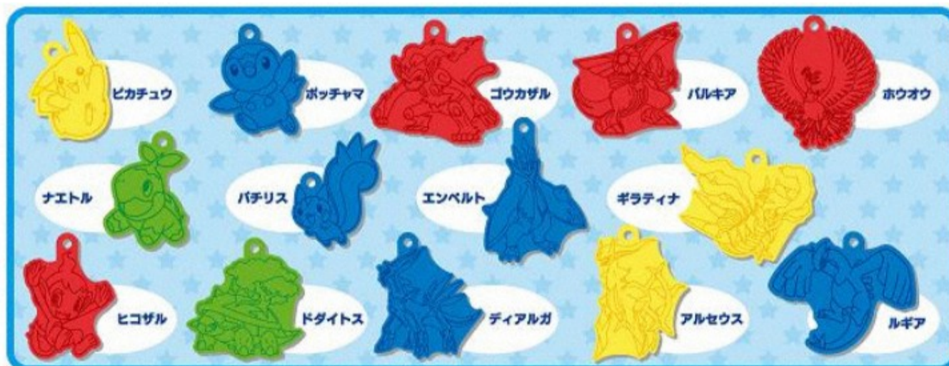
【プレート一覧】（全4色・14枚）

入浴剤の中から出てくるプレートは、全部で14枚です。アニメ、映画、ゲームなどで活躍する子供たちに人気の「ポケモン」をラインナップしました。