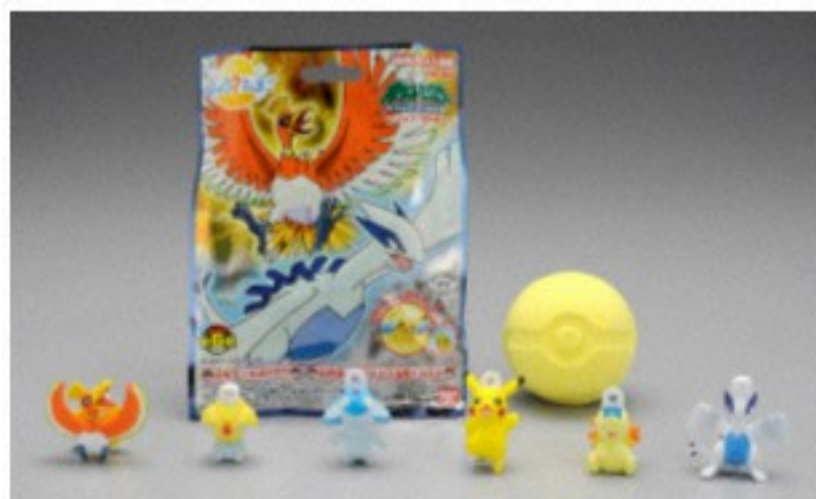
「びっくらたまご ポケットモンスター ダイヤモンド・パール～ジョウト地方編～」（発売中・315円/税込）

「びっくらたまご」（315円/税込）は、バンダイが2002年より販売している、入浴剤の中からキャラクターの人形が1個出てくる炭酸ガス入浴剤です。これまでに30種類以上のキャラクターを商品化し、シリーズ累計3,000万個を販売しています。「びっくらたまご ポケットモンスター」も現在第11弾が発売中で、人気商品の一つです。