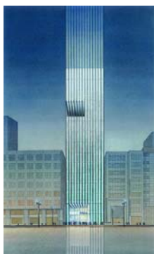
ポーラ銀座ビル外観

新「ポーラ銀座ビル」は、地上 12 階 地下 2 階建てで、旗艦店「ポーラ ザ ビューティ 銀座店」やアートギャラリー施設とともに、銀座初出店のテナント店舗を誘致し、洗練された 3 つの美である「美容」・「美術」・「美食」を提供いたします。「K・O・U」はポーラ ザ ビューティ 銀座店で直接販売を行います。