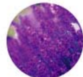
ラベンダーエキス NAL