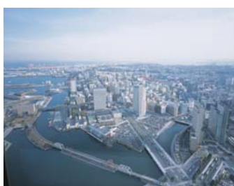
68階日本料理「四季亭」眺望例