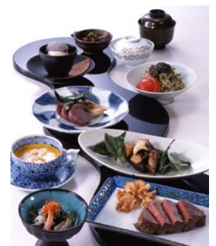
鉄板焼「よこはま」39ランチ