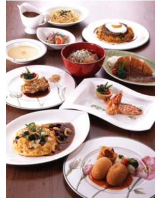
カフェ「カフェ フローラ」 39ランチセット