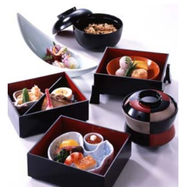
日本料理「四季亭」39ランチ