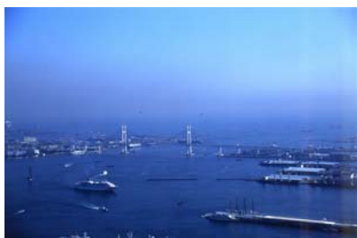
70階スカイラウンジ「シリウス」眺望例