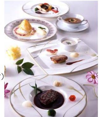
フレンチレストラン「ル シェール」 39ランチ