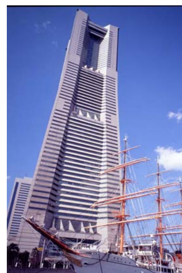
横浜ロイヤルパークホテルが入っている横浜ランドマークタワーの外観

65階には茶室、52階にアロマセラピーサロン、49階にスカイプール、地下1階にはケーキショップなどがあり、都心に程近いリゾートホテルとして快適なホテルライフを提供しています。