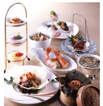
中国料理「皇苑」39ランチ