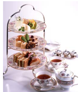
ティーサロン「ブルーベル」 39アフタヌーンティー