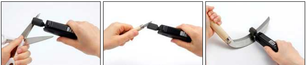
さまざまな使用例(左から、はさみ、彫刻刀、鎌)