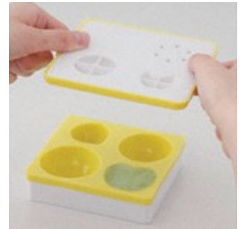
押し型で上から押しします。