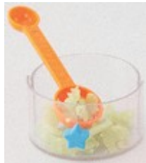
削ったせっけんを取り出し、ボウルで練ります。