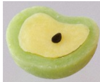
青リンゴせっけんの出来上がり。(直径約43mm程度)