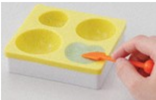
中身のせっけんを作り、外側のせっけんの中に詰めます。