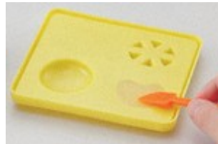
型にせっけんを詰め、