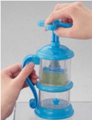
レバーを回してせっけん素材を削ります。