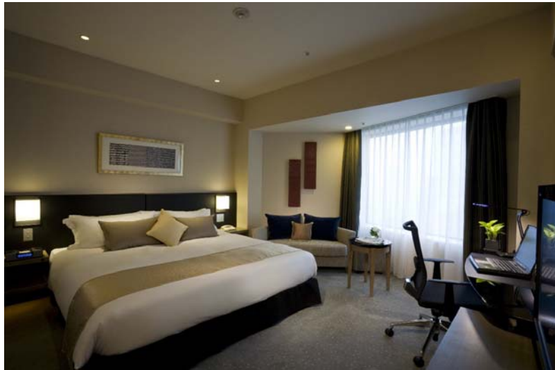
クラブフロアの ダブルルーム

部屋と浴室の界壁がシースルーの硝子使いとなっ ているため、空間の広がりを感じられる。