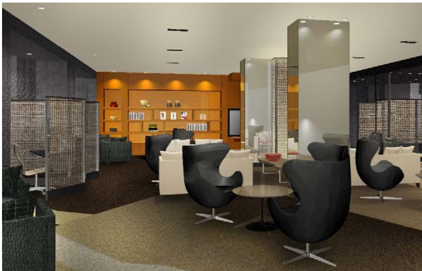
クラブラウンジ内のライブラリーエリア（イメージ） モダン感覚であっても、居住性に富んでいる。