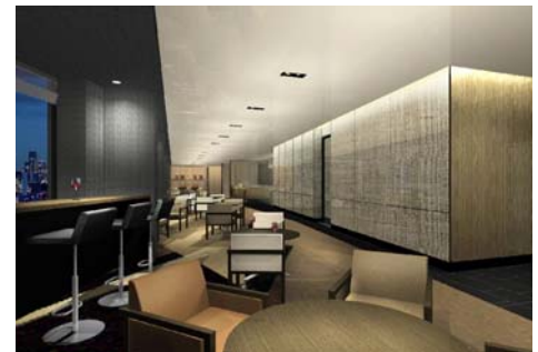
窓際にハイテーブルを配したバーエリア（イメージ） 奥がダイニングエリアとなっている。