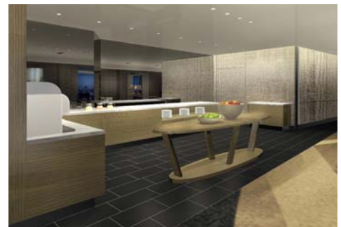
ダイニングエリア内の ブッフェコーナー（イメージ）