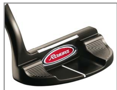
ROSSA® TP Maranello by KiaMa