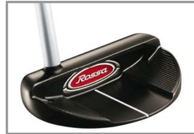
ROSSA® TP Monte Carlo by KiaMa