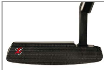
ROSSA® TP Daytona by KiaMa