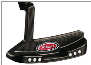
ROSSA® TP Monaco by KiaMa