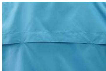
ベンチレーション 背面の切り替えにより通気性に優れ ムレ感を軽減。