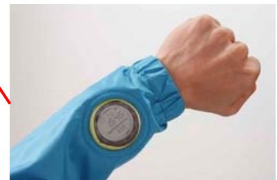
ウォッチクリアウィンドウ 左袖に、袖をまくらずリストウォッチの 時間を確認できるクリアパネルを搭載。