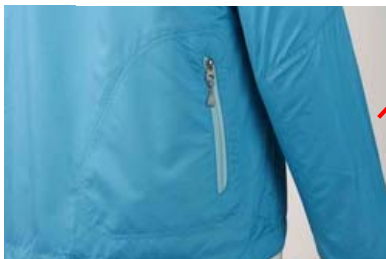
バックポケット 携帯食を収納するのに便利な バックポケット仕様。