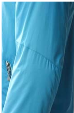
3D スパイラルカット 腕の運動機能性を高める らせん状の3D 立体パターン を採用。

<ライトジャケット> 自然の中でのアクティビティーを楽しく快適にする超撥水防風ジャケット 素材：エコロジーな再生ポリエステル糸を使用。雨風に強い超撥水機能と UV カット機能を併せ持つ。