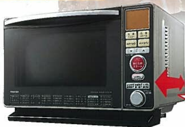
ER-G6 (H) グレー

遠赤効果とスチームでパリッと、ふっくら。 コン。パクトサイズ の 石窯オーブン。