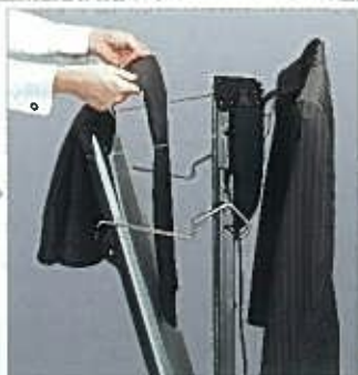
プレスシートの上に、もう片方の足を入れる。レバーを下げ、閉じる。