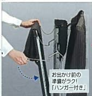
お出かけ前の 準備がラク！ 「ハンガー付き」