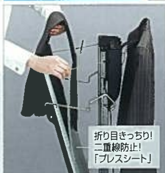
折り目きっちり！ 二重線防止！ 「プレスシート」