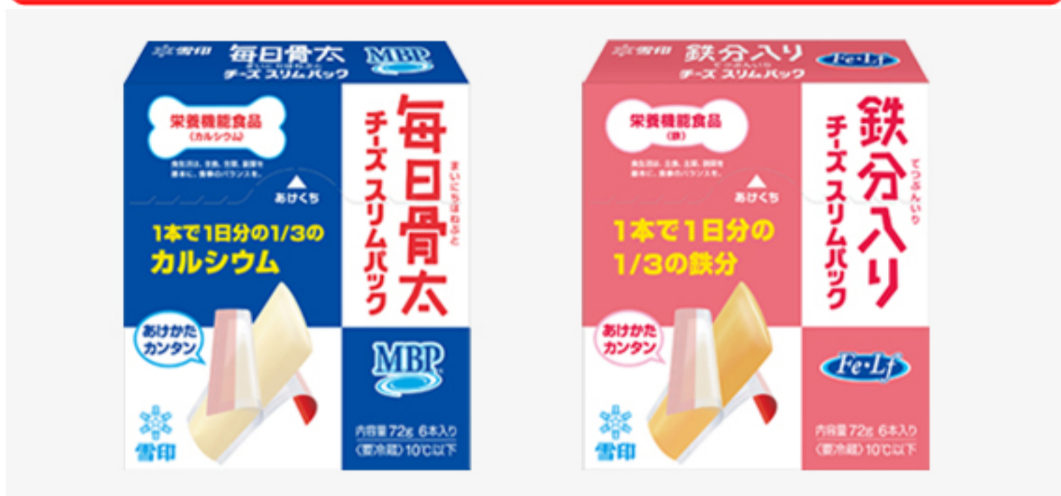
『雪印 毎日骨太MBP®チーズスリムパック』 『雪印 鉄分入りチーズスリムパック』

＜鉄分入り＞1本で1日分の1/3の鉄(2.5mg) が摂取できる(鉄ラクトフェリン配合)