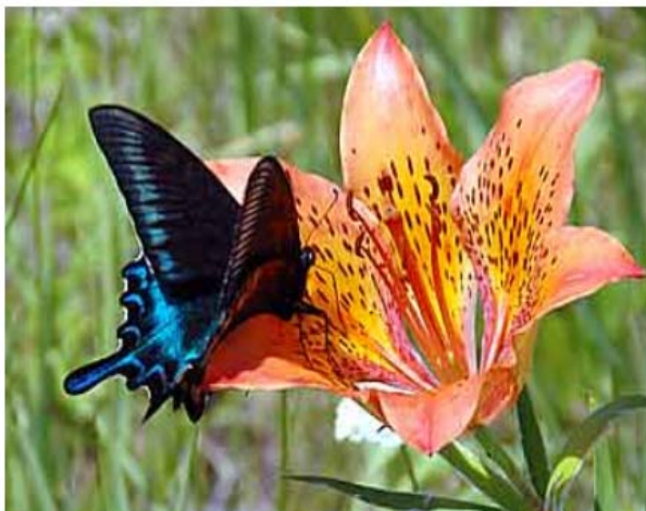
◇ ミヤマカラスアゲハ ◇

これらを融合させたモチーフとして、メガ・シャトルレディスのデザインは進められました。