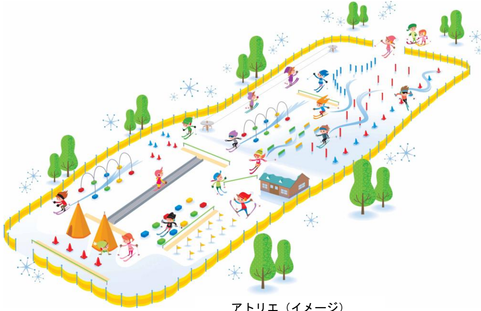
アトリエ (イメージ)