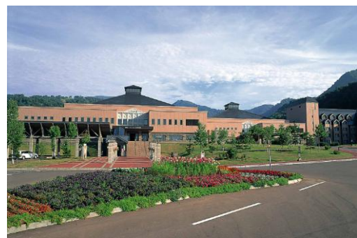
マウンテンホテル