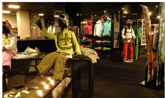
プロショップ ヴァンクール