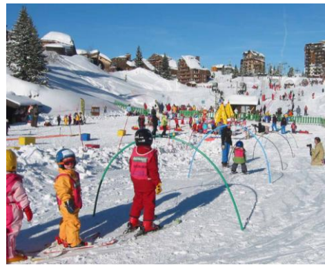
レッスン風景 (フランスにて撮影)