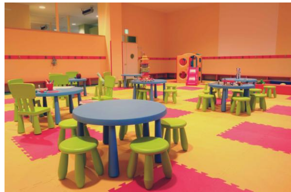
ヴィラージュ レクリエーションルーム