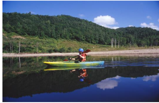
ファンカヤック（夏季）