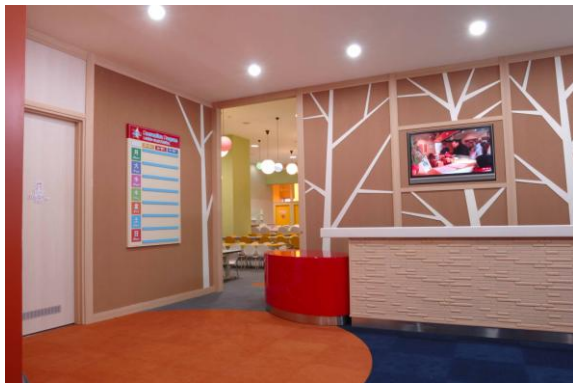
ヴィラージュ レセプション