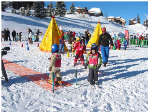
レッスン風景 (フランスにて撮影)