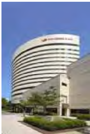
ANA クラウンプラザホテル新潟 外観