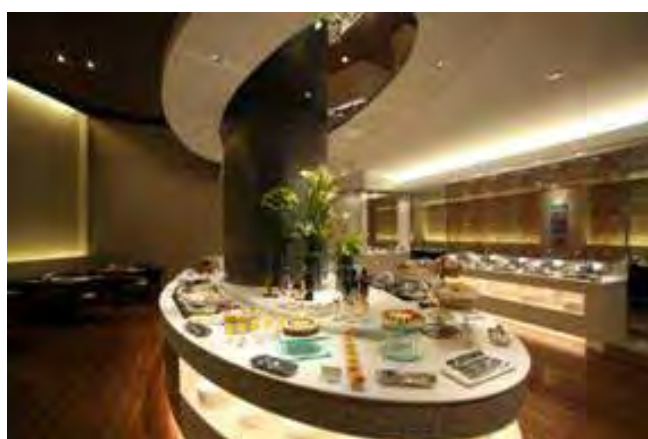
ANA クラウンプラザホテル新潟 オールデイ・ダイニング「シーズン カフェ」