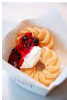
Belberry 「パパナッシュホットベリーソース」 700円