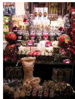
Green DeLi ディスプレイイメージ画像 クリスマスグッズ 200円～