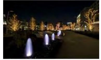
ツリーイルミネーション 点灯時間 16:00~23:00 ※プラザのみ24:00