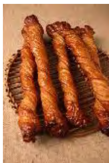
be 「サクリスタン」 378円