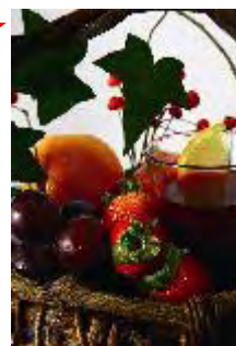
Okawari.jp 「ホットサンテリア」 価格未定