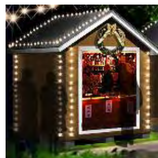
「マルシェ・ド・ノエル」 店舗イメージ画像