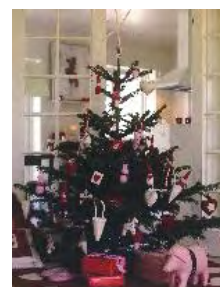
ツリー装飾 イメージ画像