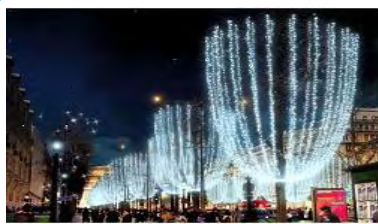
シャンゼリゼ・イルミネーション 点灯時間 16:00~23:30 ※外苑東通りのみ24:00まで