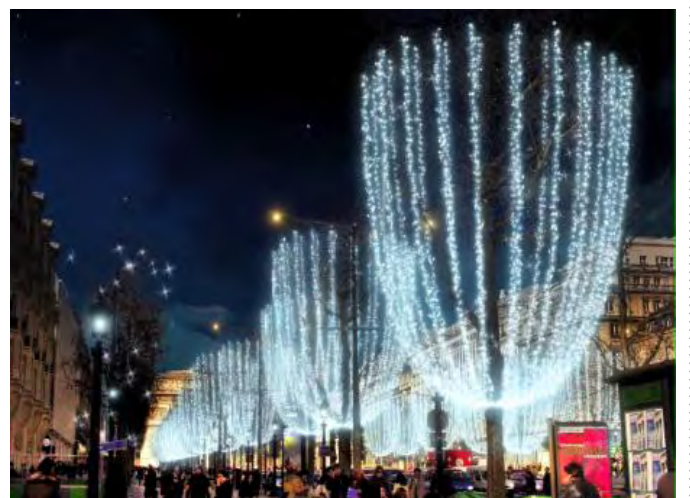
「シャンゼリゼ・イルミネーション」 イメージ画像