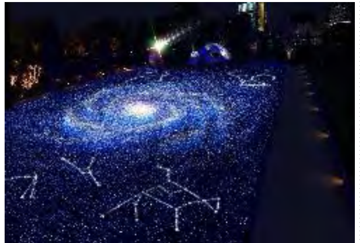
「スターライトガーデン」 イメージ画像