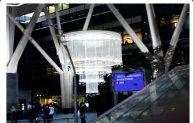
Welcome Chandelier 点灯時間 16:00~24:00