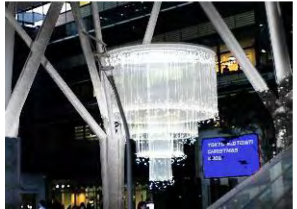
「Welcome Chandelier」 イメージ画像

5 つの基本色から、濃淡様々な色に変化し、来街者に対する多様なおもてなしを表現します。