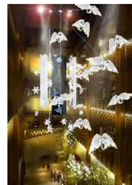
クリスマス装飾イメージ

お客様への感謝を天使からの贈り物に見立て 来街する皆様が楽しい時間を 過ごしていただけるよう想いを込めた装飾です。