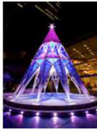
KIRIKO Tree 点灯時間 16:00~24:00