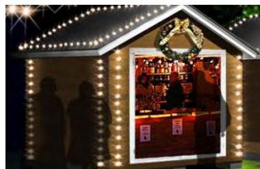
マルシェ・ド・ノエル 営業時間 16:00~21:00