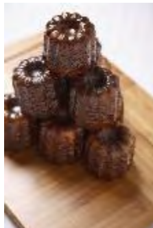
be 「カヌレ ド ボルドー」 231円