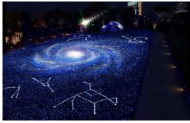
スターライトガーデン 点灯時間 16:00~23:00