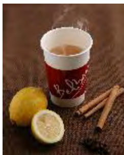
Belberry 「ホットジンジャーレモネード」 450円