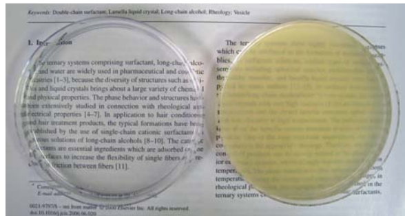
本研究のベシクル