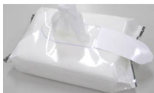
改良品 ふたのシールが戻らず、1枚ずつ取り出しやすい。