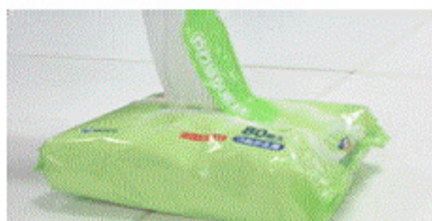
当社従来品 ふたのシールが戻ってしまい取り出しにくい。