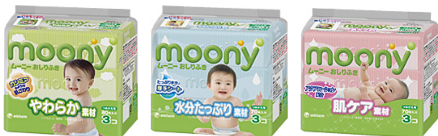
『ムーニー おしりふき やわらか素材』

ユニ・チャーム(株)は、ウォルト・ディズニー・ジャパン(株)ディズニー・コンシューマ・プロダクツとのライセンス契約により、素材にこだわった3種類のベビー用おしりふき『ムーニー おしりふき』素材シリーズを、2008年10月7日から全国にて改良新発売いたします。