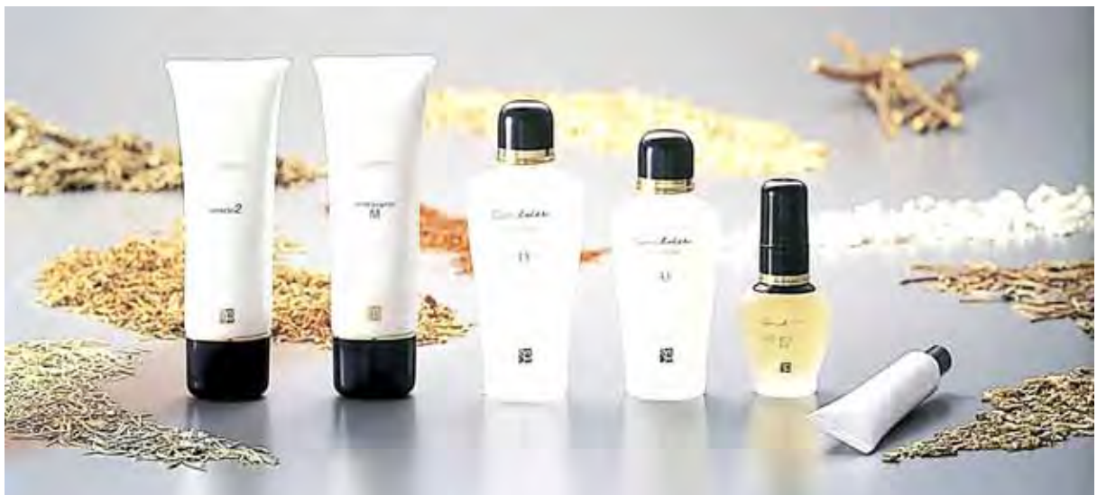
<1990年から発売されているカルディシリーズ>

女性がいつまでも美しく、そしてこれからもより輝けるように…これからもダスキンヘルス&ビューティは、女性の美を応援します。