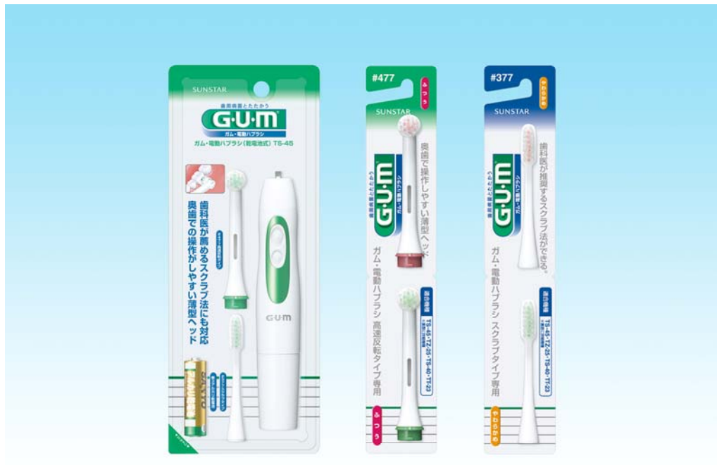
G·U·M 電動ハブラシ TS-45