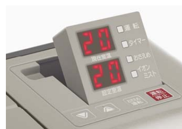
[図6 表示部のチルトアップ]

「運転・停止」や「おさえめ運転」、「温度調節」といった主要操作部のボタンを室内機本体に搭載し、リモコンと本体の双方での操作を可能としました。また、本体上面には、大きな文字のLED表示部を採用し、現在室内温度と設定室内温度をわかりやすく表示するとともに、表示部をチルトアップ可能とし(図6)、正面からも見やすくしました。そのほか、毎日決まった時刻の電源ON/OFFを予約できる、「毎日予約」機能やチャイルドロック機能など、便利な機能も充実しています。