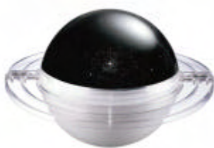
HOMESTAR Spa 本体