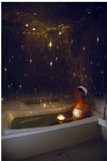
投影イメージ< Bath Star >