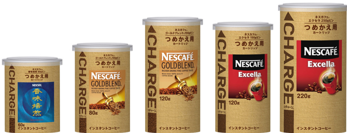
写真：左より「ネスカフェ 香味焙煎 チャージ 60g」「ネスカフェ ゴールドブレンド チャージ 80g」 「ネスカフェ ゴールドブレンド チャージ 120g」「ネスカフェ エクセラ チャージ 120g」 「ネスカフェ エクセラ チャージ 220g」