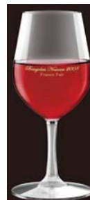
ご購入特典のオリジナルワイングラス