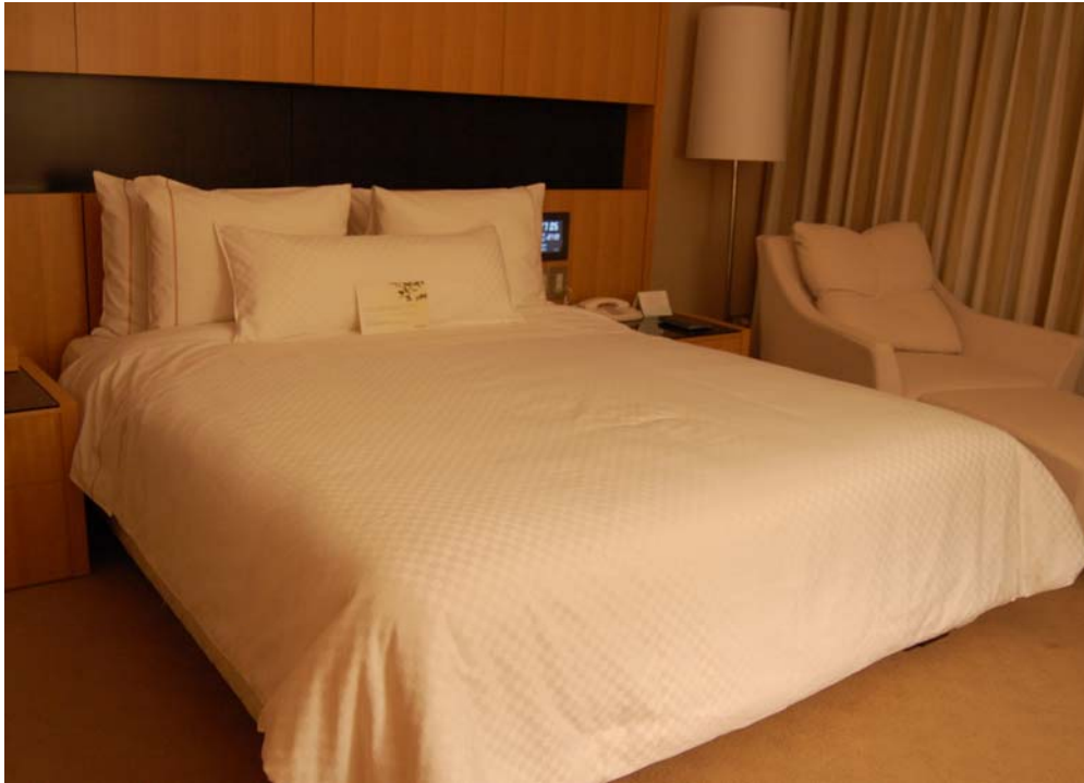
ウェスティンナゴヤキャッスル 804 号室「キャッスルアスリープ」