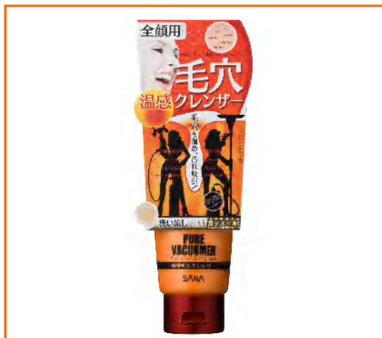
サナ ポアバキューマー 温感毛穴クレンザー

その第2弾は一気に「全顔対応」！今度は水なし、塗るだけで発熱し、毛穴を温め汚れを吸引します。週に一度使うだけですっきりつるつる肌を実感できます。