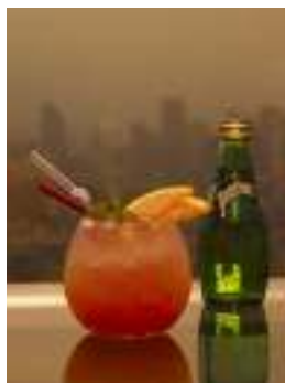
(左)ペリエカフェイメージ (中)アクアリウム ¥900 (右)サンライト ¥700