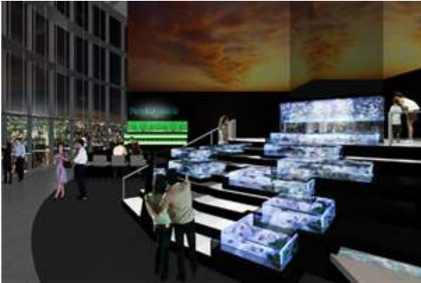
「パラダイス・フォール」(イメージ図)