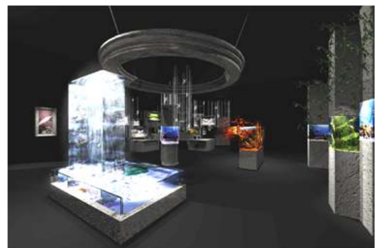
「アクアリウム・ラボ」(イメージ図)

世界の珍しい魚や特殊な生態を持つ水中生物などを展示。生命体そのものの美しさや魅力に迫ります。きれいに保たれた水の中で生き続ける命は、生命の源である水と生き物との関係を考えさせてくれます。