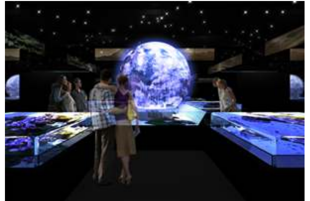
「アース・アクアリウム」(イメージ図)