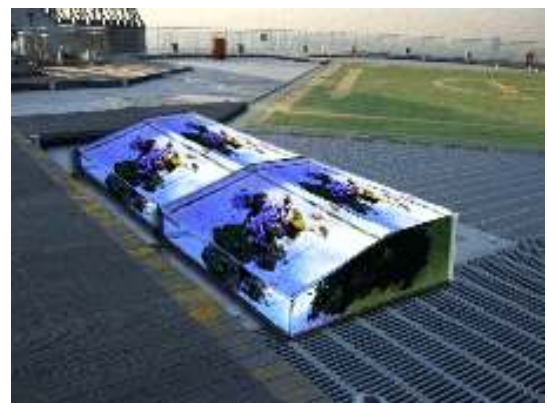
森タワー屋上「スカイデッキ」での コーラル・ファーム・プロジェクト(イメージ)

オープンエアの展望施設として日本一の高さを誇るスカイデッキでは、パラオの海に生息する珊瑚の人工養殖に挑戦。日差しを遮るものが一切ない超高層ビルの屋上は、太陽の光が降り注ぐ海の状態に近く、珊瑚の成長に適しています。環境問題に着目した自然再生の試みです。