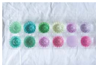
「キラキラ色水あそび」 野菜からとる色水で実験!