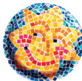
「モザイク画づくり」 四角く切った紙を貼って作るモザイク画