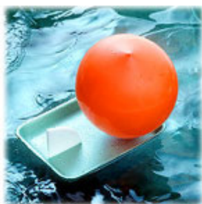
「風船ジェットポート」 風船と発泡スチロールで作るジェットポート