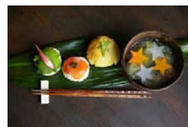
「天の川のお吸い物と手まり寿司」