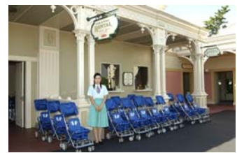
「ベビーカーレンタル」