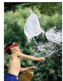
「大きな大きな水風船」