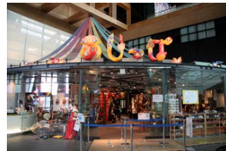
「九州国立博物館あじっば」