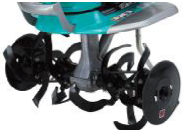
《 一般 の ロータ 》

六角ドラム形状の大径ロータは、推進力が高く安定感があるので、初めて扱う方でも簡単に安定した耕うん作業が行えます。