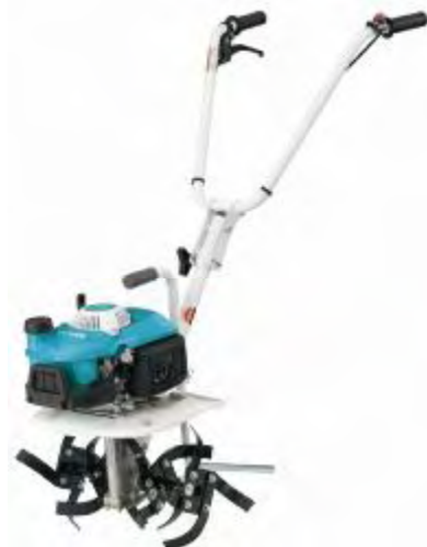
《NEW Midy TMB250》

ハンドルのレバーを握れば進み、放せば止まる簡単操作や、軽い力でエンジンが始動できる「リコイルスターター」など、女性やお年寄りの方でも簡単に操作ができます。