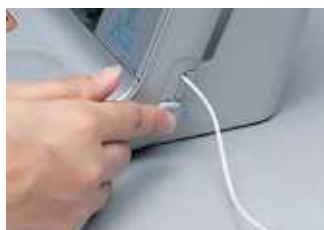
コード巻取り収納

本体とパッドをつなぐパッドコードは、簡単に巻取り収納ができるので、使用後には簡単に収納できます。また、本体背面には大型ポケット「パッド収納ボックス」を設置し、4枚のパッドをすっきりと収納することができます。