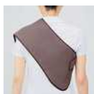
肩 + 背中