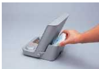
パッド収納ボックス