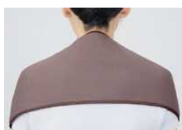
首 + 肩

新開発の大型温熱サポーターが、肩や腰、背中のこりや痛みの部分を包み込み、効果的に温めます。広範囲を温めることで血行を改善し、つらい症状を緩和します。「低温」「中温」「高温」の温度調整が可能なので、好みの温度で治療を行えます。