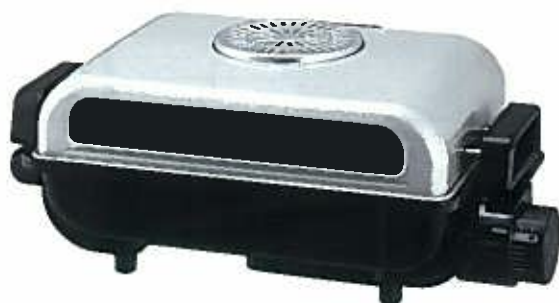
FG-20SA (S) シルバー

焼き魚はもちろん幅広いグリル料理に対応。 高温赤熱ワイドヒーターで、両面を一気にこんがり焼き上げる!