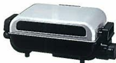
FG-10A (S) シルバー