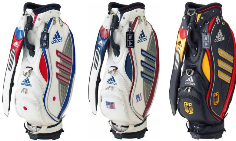
<ホワイト/ブルー> <ホワイト/ネイビー> <ブラック>