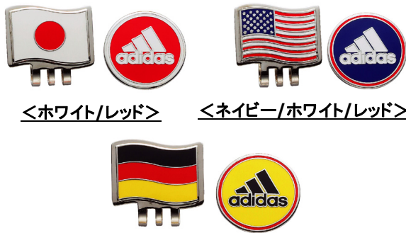
<ホワイト/レッド> <ネイビー/ホワイト/レッド>