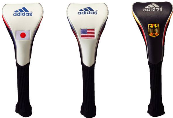
<ホワイト/ブルー> <ホワイト/ネイビー> <ブラック>