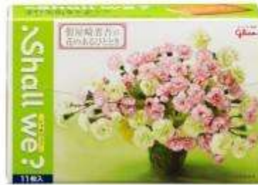
写真：左『クラッシュポッキー』右『シャルウィ?』