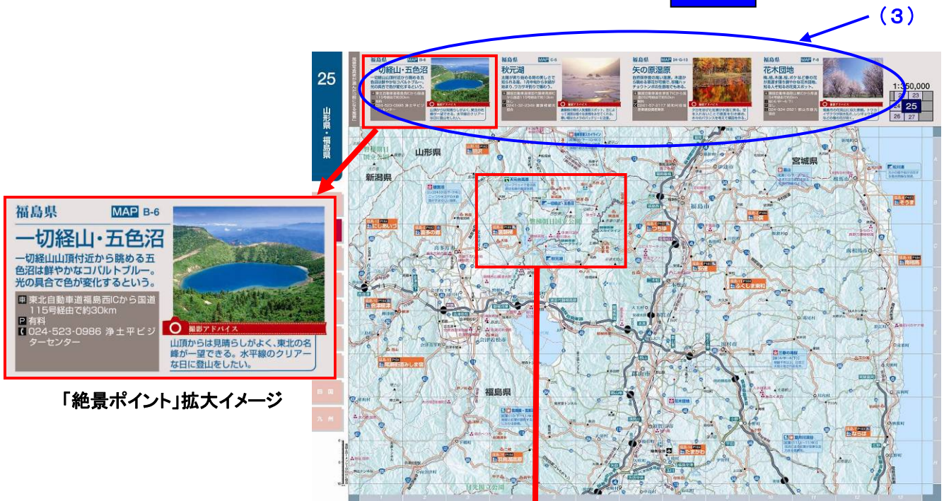
「絶景ポイント」拡大イメージ