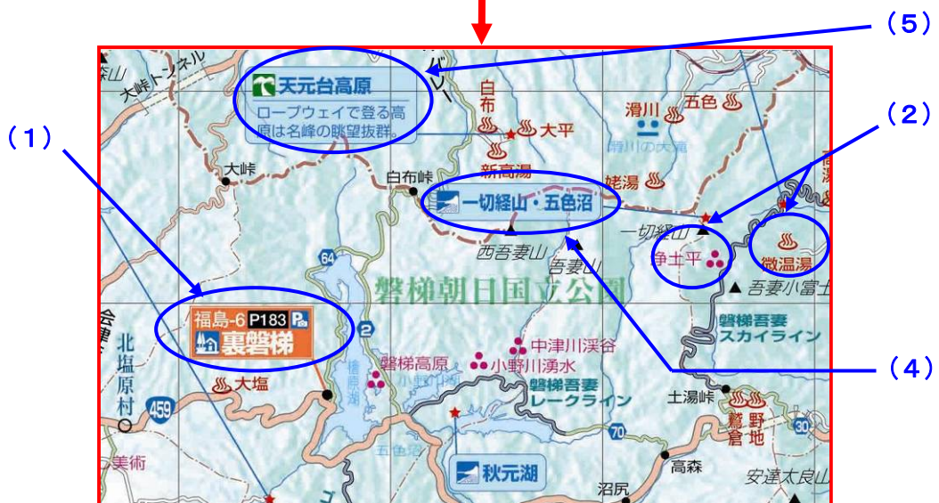
ロードマップ部分拡大イメージ