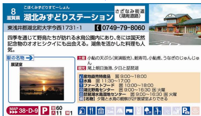
今版の「道の駅」紹介ページ