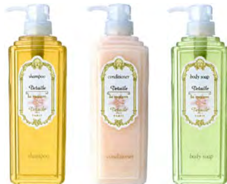
シャンプー コンディショナー ボディソープ