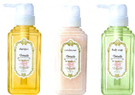
シャンプー コンディショナー ボディソープ