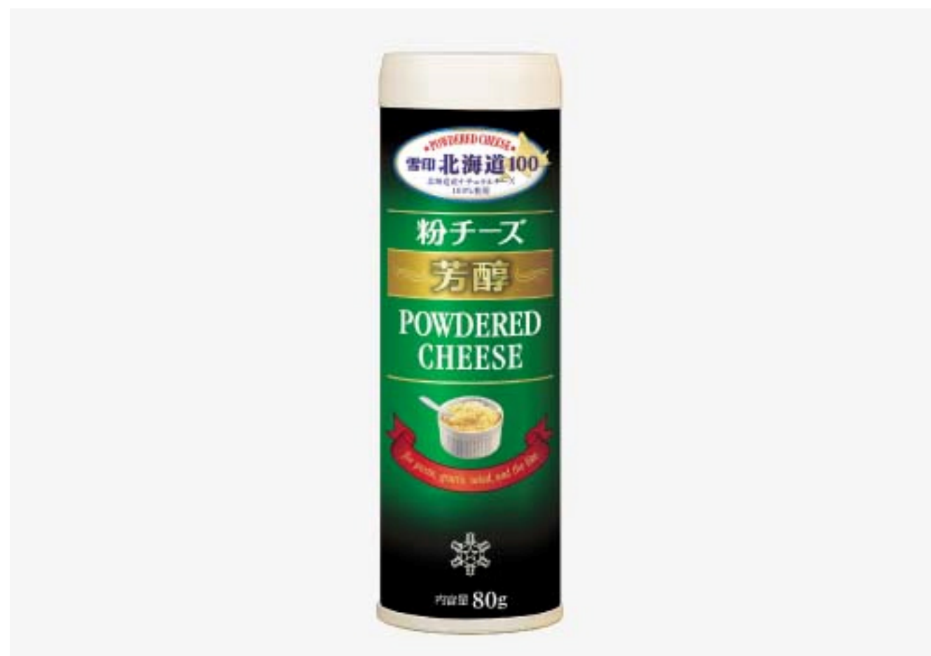
『雪印北海道100 粉チーズ芳醇』