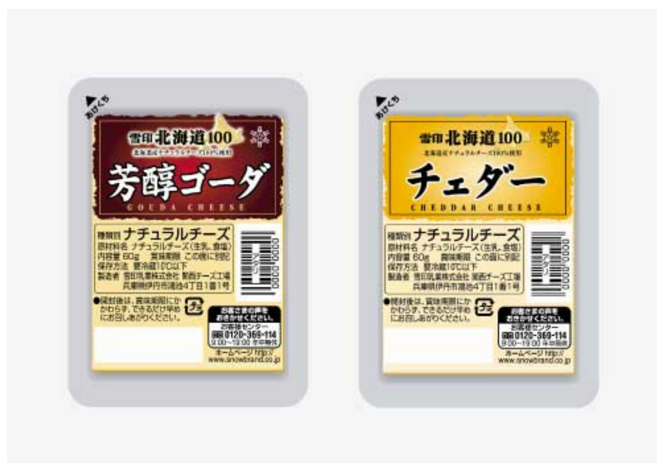
『雪印北海道100 芳醇ゴーダ』