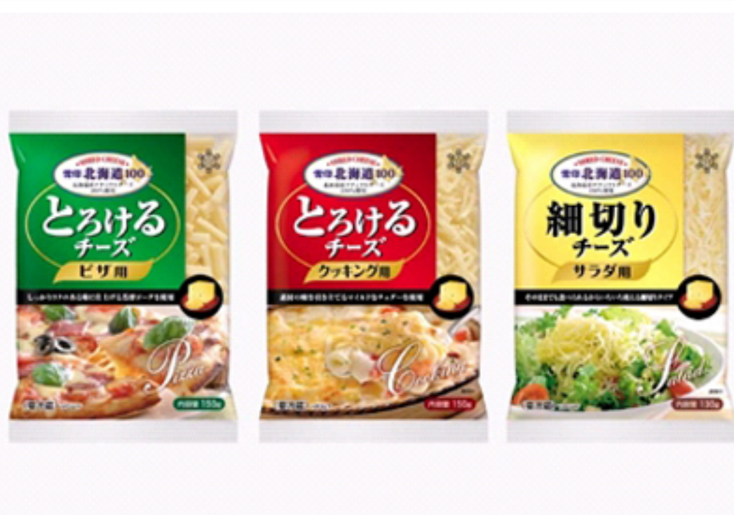
『雪印北海道100 とろけるチーズ ピザ用』 『雪印北海道100 とろけるチーズ クッキング用』 『雪印北海道100 細切りチーズ サラダ用』

北海道産ナチュラルチーズを100%使用し、 食シーンに合わせてブレンドしたシュレッドチーズ