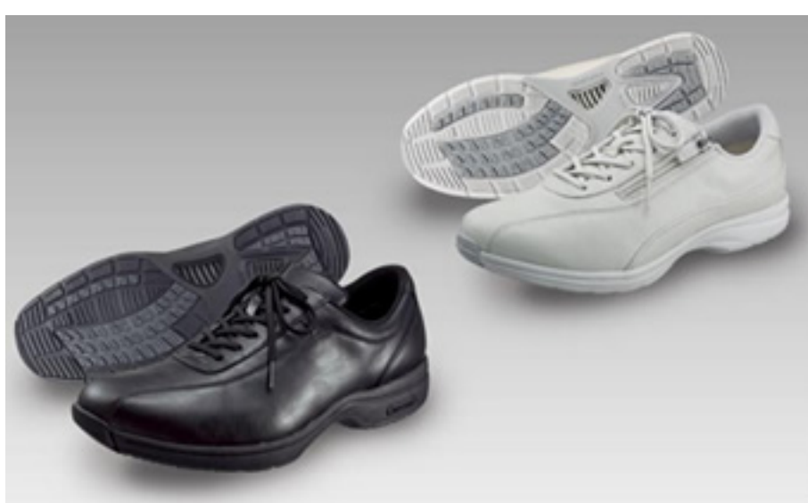
SHTW80(左下・メンズ) SHTW85(右上・レディース)